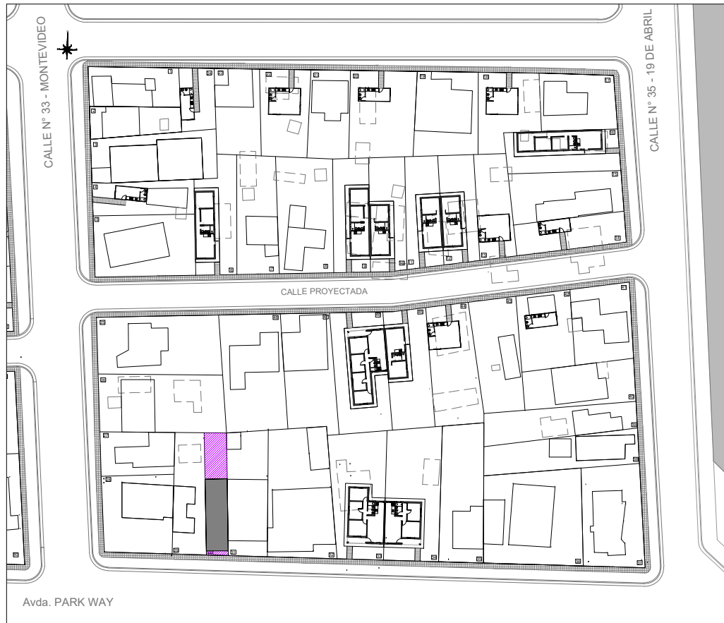
Plano de ubicación esc. 1.1000